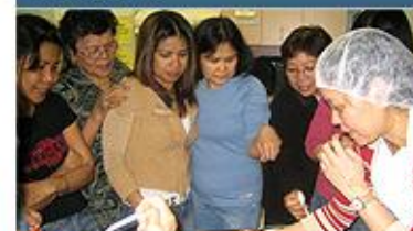
Programme de nutrition entre pairs

Le Peer Nutrition Program (programme de nutrition entre pairs) fournit de l'information sur la nutrition adaptée sur les plans culturel et linguistique aux parents, aux grands parents et aux soignants d'enfants âgés de 6 mois à 6 ans dans